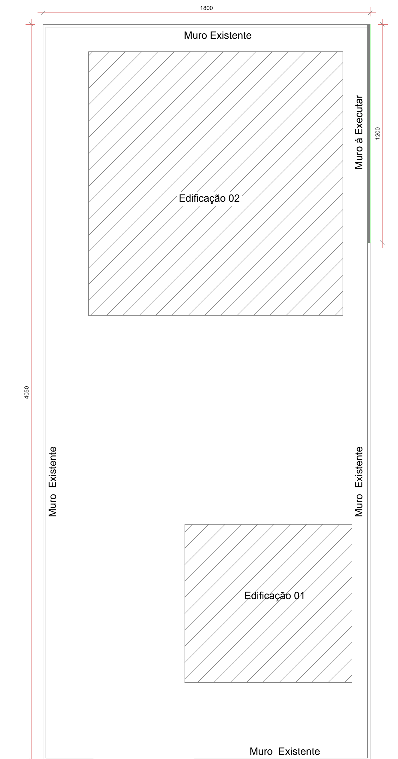
Rua Presidente Washinton Luis Planta Baixa - Muro Escala 1 / 125