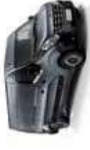
CINZA ACIER (PM)