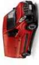
VERMELHO VIVO (CO)