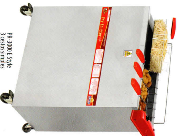
PR-3000 E Style 3 cestos simples 1 cesto duplo