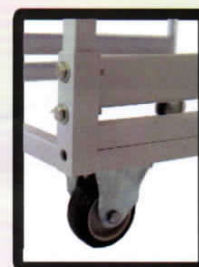
Rodízios super resistentes Ruedas super resistente Super tough casters