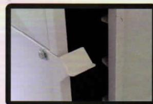
Sistema abre/fecha Sistema abre y cierra Open/close system

Bandeja para pão salgado (58x68cm) opcional Bandeja para pan salado opcional (58x68cm) Tray to salty bread optional (58x68cm)