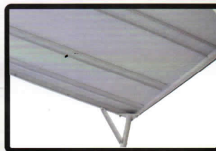
Tampo superior, visto por baixo da bancada Tampo Superior, se observa bajo la soporte Top Cover, viewed under the stand