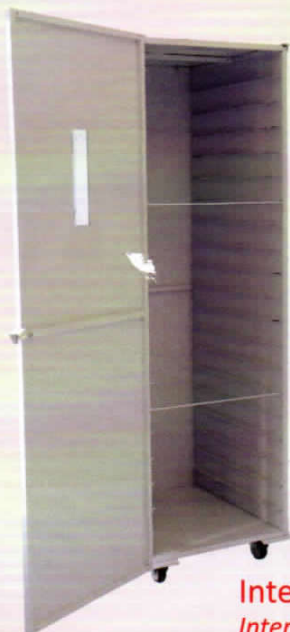
Interior do AC20 Interior del AC20 Inside the AC20