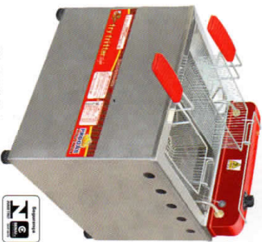
PR-100 E Style 2 cestos simples