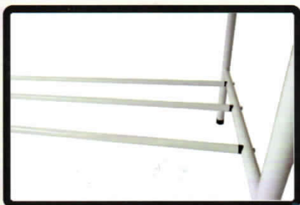
Panelero Cacerolero Fagget