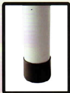
Pés emborrachados, anti-derrapantes Pies de goma, antideslizante Rubberized feet, anti-skid