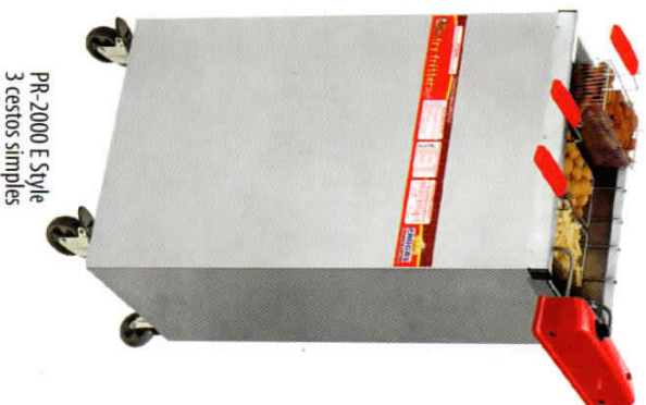
PR-2000 E Style 3 cestos simples