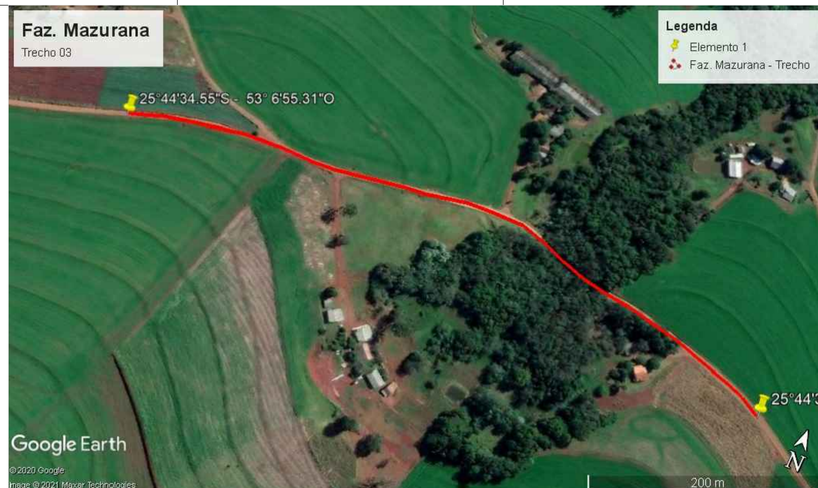
PLANTA DE LOCALIZAÇÃO